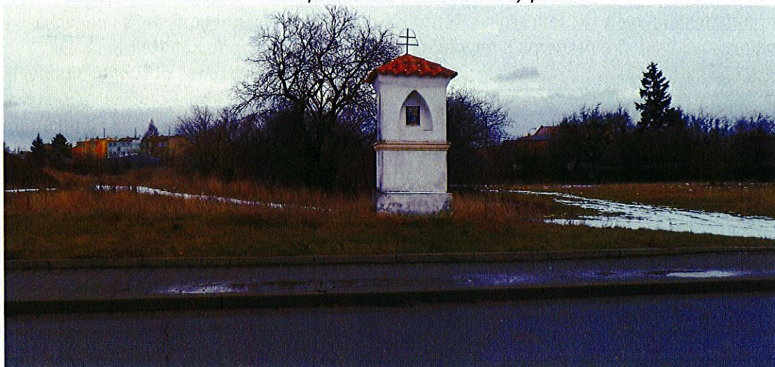
Vyškov-Nosálovice, boží muka